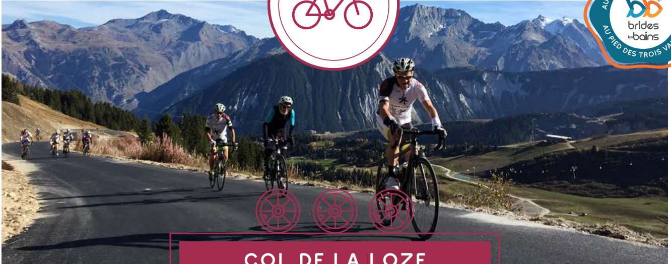
COL DE LA LOZE