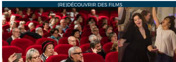
(RE)DÉCOUVRIR DES FILMS

Ouvert 7j/7j de 19h30 à 2h. casino3vallees.com