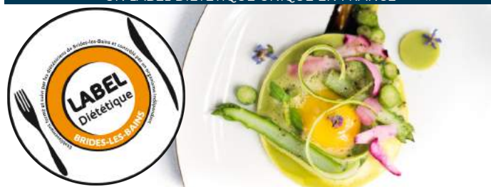
UN LABEL DIÉTÉTIQUE UNIQUE EN FRANCE