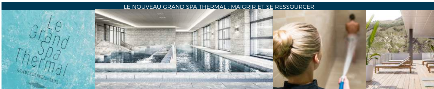
LE NOUVEAU GRAND SPA THERMAL : MAIGRIR ET SE RESSOURCER