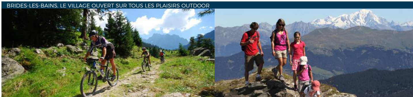
A pied, à VTT ou en vélo, sur l'eau ou dans les airs, Brides-les-Bains la destination de ceux qui veulent tout goûter