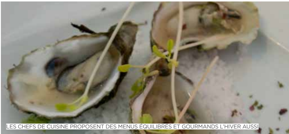
LES CHEFS DE CUISINE PROPOSENT DES MENUS ÉQUILIBRÉS ET GOURMANDS L'HIVER AUSSI