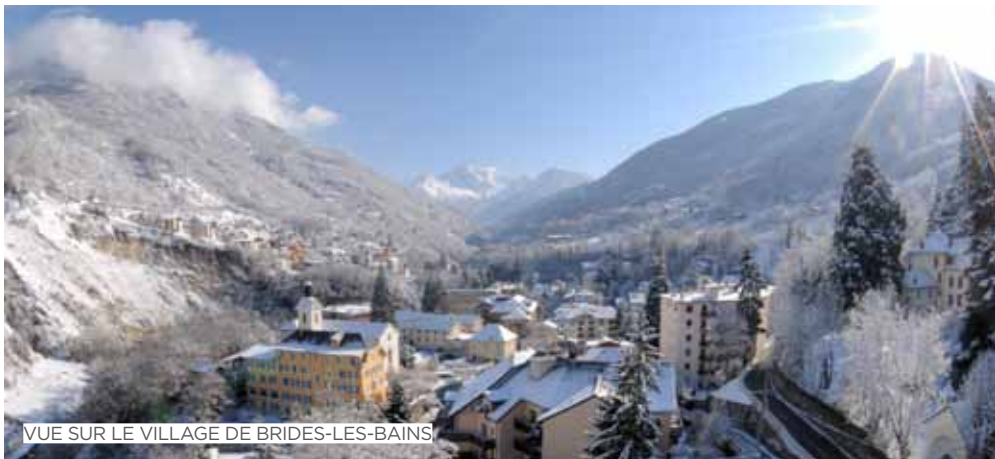
VUE SUR LE VILLAGE DE BRIDES-LES-BAINS