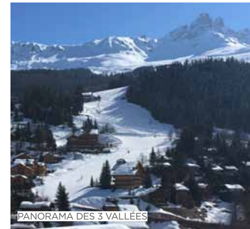
PANORAMA DES 3 VALLÉES