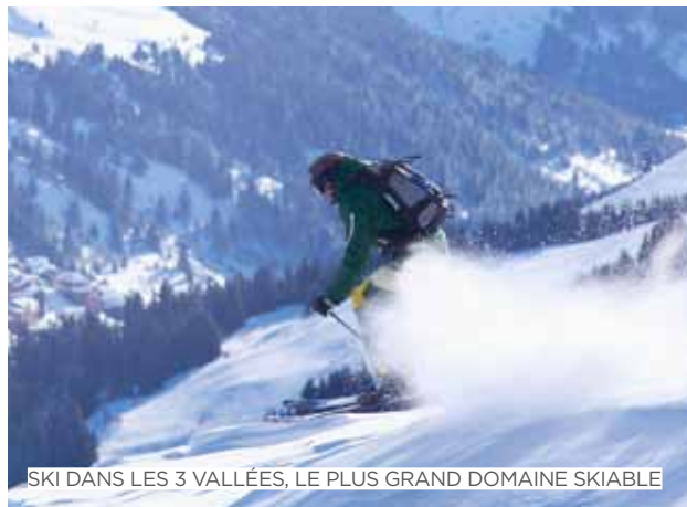
SKI DANS LES 3 VALLÉES, LE PLUS GRAND DOMAINE SKIABLE