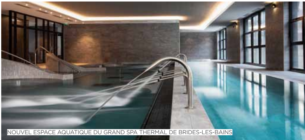
NOUVEL ESPACE AQUATIQUE DU GRAND SPA THERMAL DE BRIDES-LES-BAINS