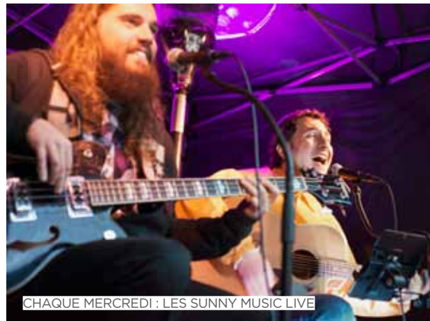
CHAQUE MERCREDI : LES SUNNY MUSIC LIVE