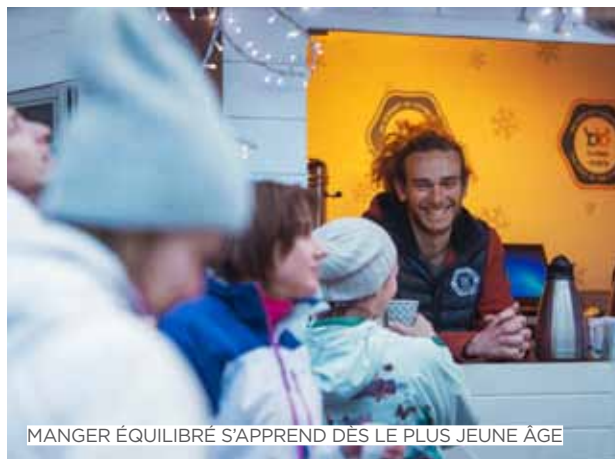
MANGER ÉQUILIBRÉ S'APPREND DÈS LE PLUS JEUNE ÂGE