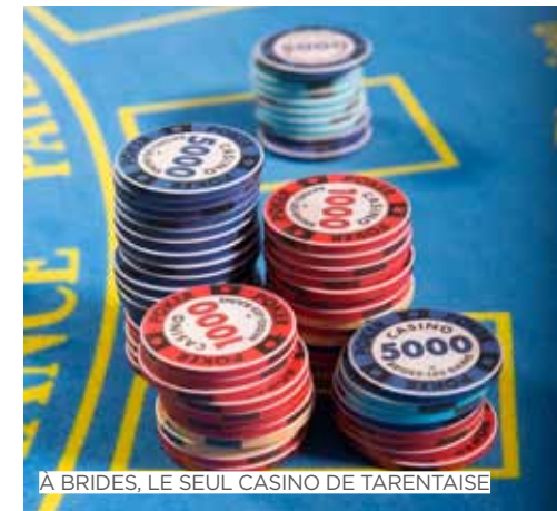
A BRIDES, LE SEUL CASINO DE TARENTEISE