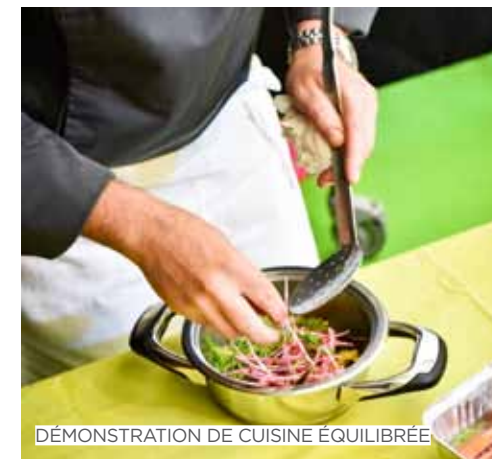
DÉMONSTRATION DE CUISINE ÉQUILIBRÉE

SEMAINE ESKILIBRE ET GOURMANDISE 14/18 JANV 2019