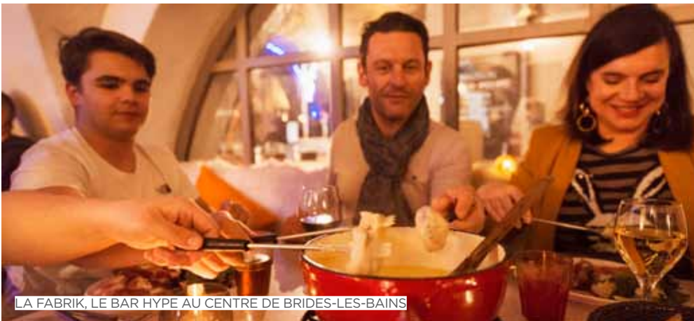
LA FABRIK, LE BAR HYPE AU CENTRE DE BRIDES-LES-BAINS