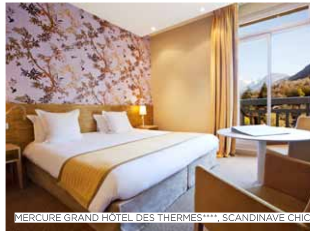
MERCURE GRAND HOTEL DES THERMES****, SCANDINAVE CHIC