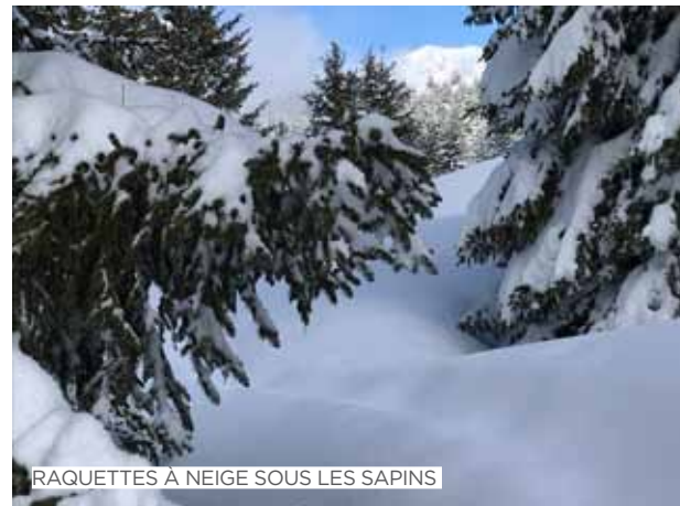
RAQUETTES À NEIGE SOUS LES SAPINS