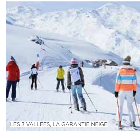
LES 3 VALLÉES, LA GARANTIE NEIGE