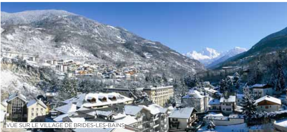
VUE SUR LE VILLAGE DE BRIDES-LES-BAINS