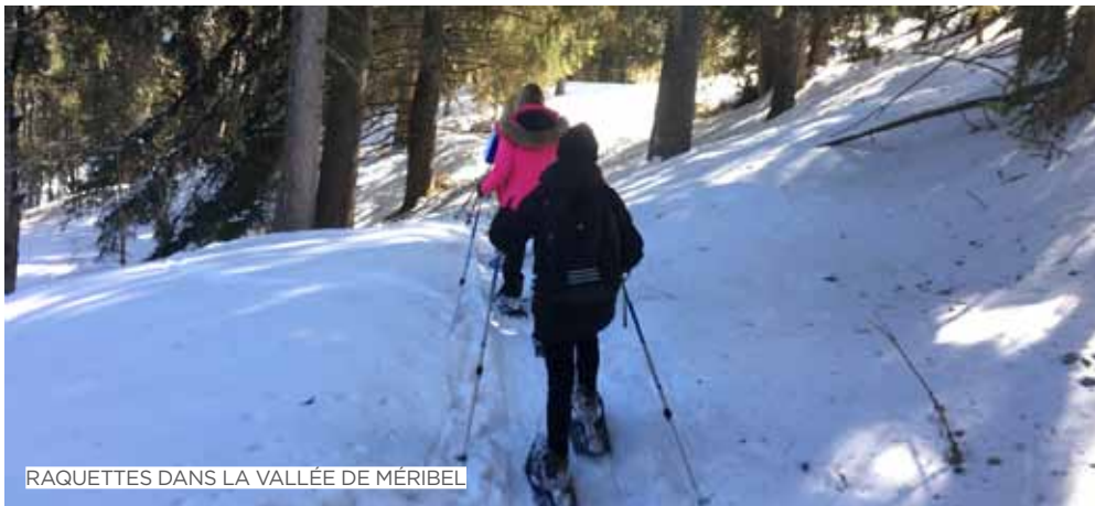
RAQUETTES DANS LA VALLÉE DE MÉRIBEL