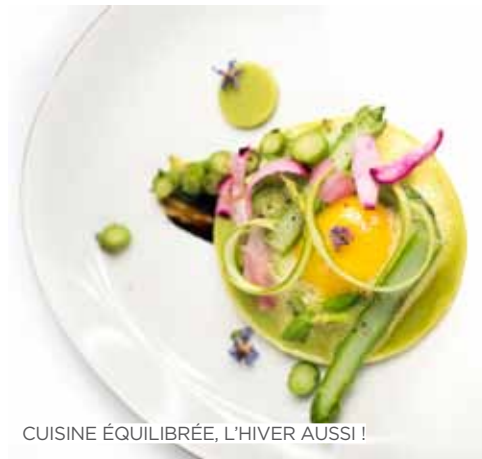
CUISINE ÉQUILIBRÉE, L'HIVER AUSSI !