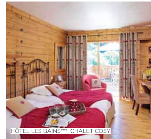
HÔTEL LES BAINS***, CHALET COSY