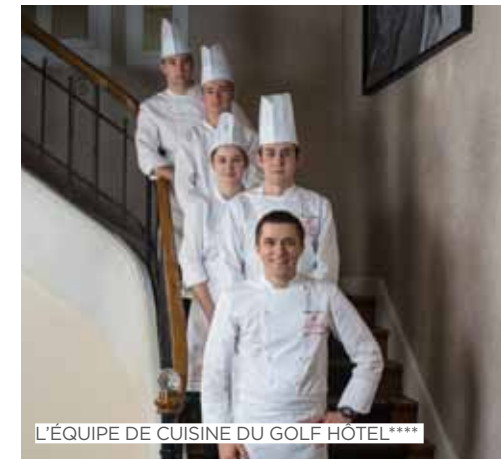
L'ÉQUIPE DE CUISINE DU GOLF HÔTEL****