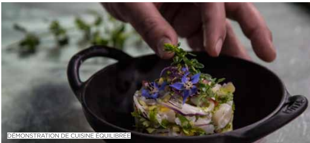
DÉMONSTRATION DE CUISINE ÉQUILIBRÉE