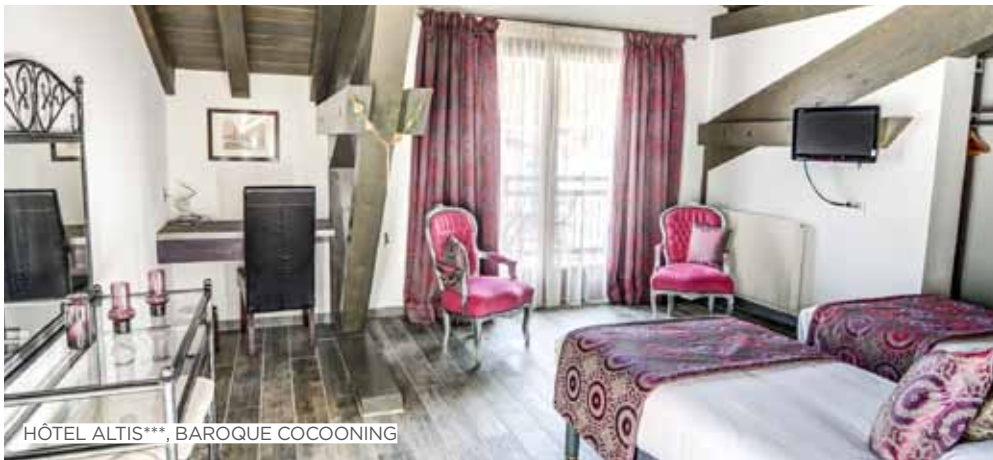
HÔTEL ALTIS***, BAROQUE COCOONING