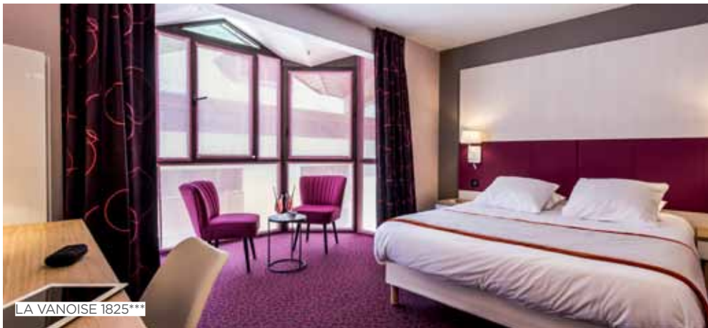
LA VANOISE 1825****