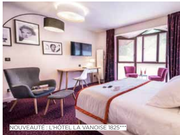
NOUVEAUTÉ : L'HÔTEL LA VANOISE 1825***