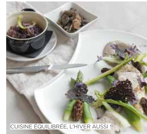
CUISINE ÉQUILIBRÉE, L'HIVER AUSSI !