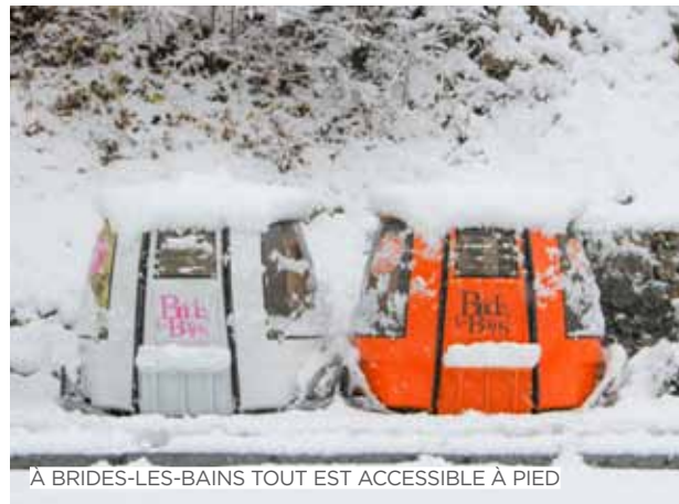
À BRIDES-LES-BAINS TOUT EST ACCESSIBLE À PIED