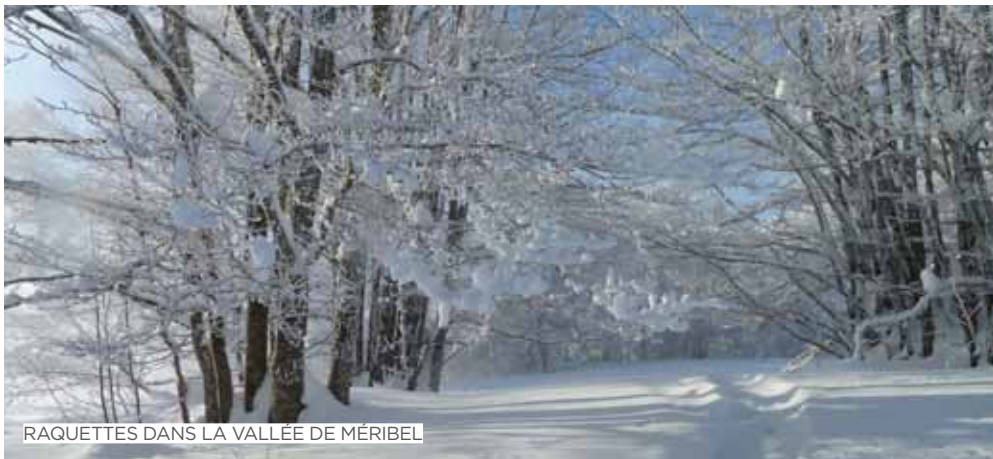
RAQUETTES DANS LA VALLÉE DE MÉRIBEL